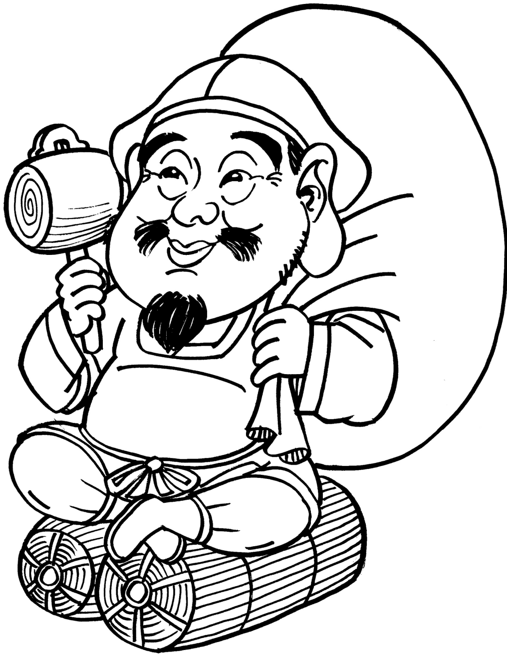
En honor de Daikokuten, el Dios de la riqueza