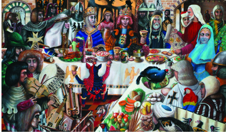
Bild (3): Eine der am weitesten verbreiteten Gebräuche im England des Mittelalters waren die Weihnachtsfeiern mit großen Banketten, wobei der Hauptgang ein lebender Pfau war. Dieser schöne Vogel wurde getötet und vorsichtig gehäutet, um die Feder nicht zu ruinieren, dann wurde er mit Eiern und Gewürzen gestopft und gebraten. Schließlich wurde er mit seiner eigenen Haut umhüllt und mit Gold geschmückt. Als die Pilgrim Brothers in Amerika ankamen, haben sie fast sofort den Pfau durch den Truthahn ersetzt, der damit das kulinarische Symbol für das amerikanische Weihnachtsfest wurde

Die Zeit für weihnachtliche Freude war dennoch kurz. Die Inquisition in Spanien und Italien war gegenüber Tänzern und Liedern sehr streng, hielt sie für Versuchungen des Teufels und sie wurden deshalb erneut verboten und bekämpft. Deutschland und England unterstützten die neue Welle von Protestantismus, und stürzten die Menschen in strikteste Enthaltsamkeit. Sogar das sehr katholische Frankreich, nunmehr von den Herrschern Spaniens unterdrückt, die dorthin zogen für politisch motivierte Hochzeiten, bewaffnet mit Kreuzen und Rosenkränzen, verlor seine Tanztradition. In diesen dunklen Zeiten vergaßen die Menschen die Weihnachtslieder nicht, die im privaten als Protest besonders in England gesungen wurden, obwohl Cromwell und seine strikten