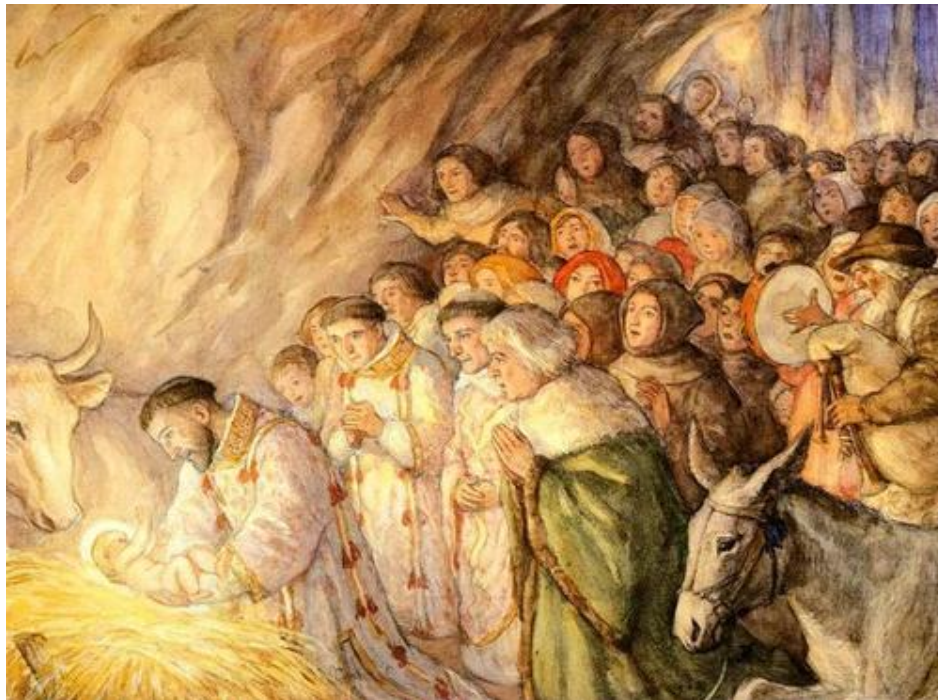
Bild (2): Der heilige Franziskus hat oft an christlichen Spielen teilgenommen, bei denen er um Mitternacht ein neugeborenes Kind in eine Krippe legte und gleichzeitig die Heilige Messe feierte. Auf diese Weise wurden die Mysterien von Jesu Geburt und die Jungfräulichkeit Marias dem ungebildeten Volk auf einfache und wirksame Weise nahegebracht.

Auszeichnung, die beste Szene des Krippenspiels auf die Bühne gebracht zu haben. der Höhepunkt war am 25. Dezember, an diesem Tag fanden Freudvolle Tänze sowohl im freien, und wenn das Wetter dies nicht erlaubte, in der Kirche statt. damit wurde der Glaube aufgehoben, das Tanzen zu Ehre des Herrn Deine Sünden darstellt. es muss gesagt werden, dass die Kirche zunächst diese Innovation nicht guthieß, aber der Ruhm von Franz' Heiligkeit war so rein und nicht verunreinigt, dass der Papst es durchließ, auch weil diese freudvolle Sitte in Frankreich, Spanien und Deutschland angekommen war, und so öffentlichkeitswirksam war für das Christentum, das ein Verbot einem Schuss ins Knie gleichgekommen wäre.