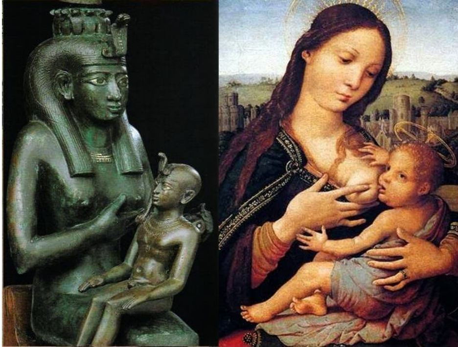
Bild (1): Hier ist die außerordentliche Übereinstimmung zwischen der Göttin Isis und der christlichen Jungfrau. Es gibt verschiedene Ähnlichkeiten: Uns fällt die zentrale Rolle der zwei Figuren sowohl in der heidnischen und dann in der christlichen Religion auf. Beide wurden als sterblich erachtet, jungfräulich, und verbunden mit der Figur des „ Erlösers“, Horus für Isis und Christus für Maria, die in der klassischen Ikonographie dargestellt werden als das Kind, das in den Armen einer Frau gehalten wird, und von ihr die Brust erhält.

So ist es auf der ganzen Welt. Und die ganze Welt feierte fröhlich an Weihnachten, das Reich an Tänzen und Liedern war, zwischen Geschlechtsverkehr und Trinken, bis das Christentum kam, und alles über den Haufen warf. Natürlich Verbot es sex und die Annehmlichkeiten des Festes, die nicht mit dem Bild von Marias Reinheit in Einklang zu bringen waren; dann kam der Tanz an die Reihe, der als ein „Geschenk des Teufels“ angesehen wurde. Schließlich wurden die heidnischen Lieder ausgetauscht, weil sie immer noch seltsame Götter der Vergangenheit lobten, und vermischten sie mit christlichen.