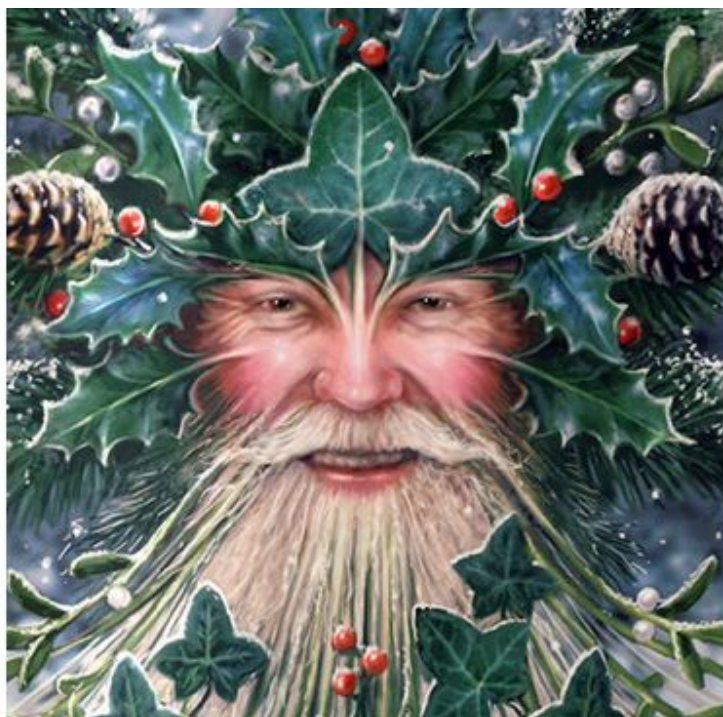
Der Geist von Weihnachten

Es mag schwer zu glauben sein, aber Weihnachten ist eigentlich ein heidnisches Fest. Ursprünglich war es ein Fest, das Zauberern und Hexen vorbehalten war, die am Tag der Wintersonnenwende, d.h. am 22. Dezember, um einen Baum oder, noch