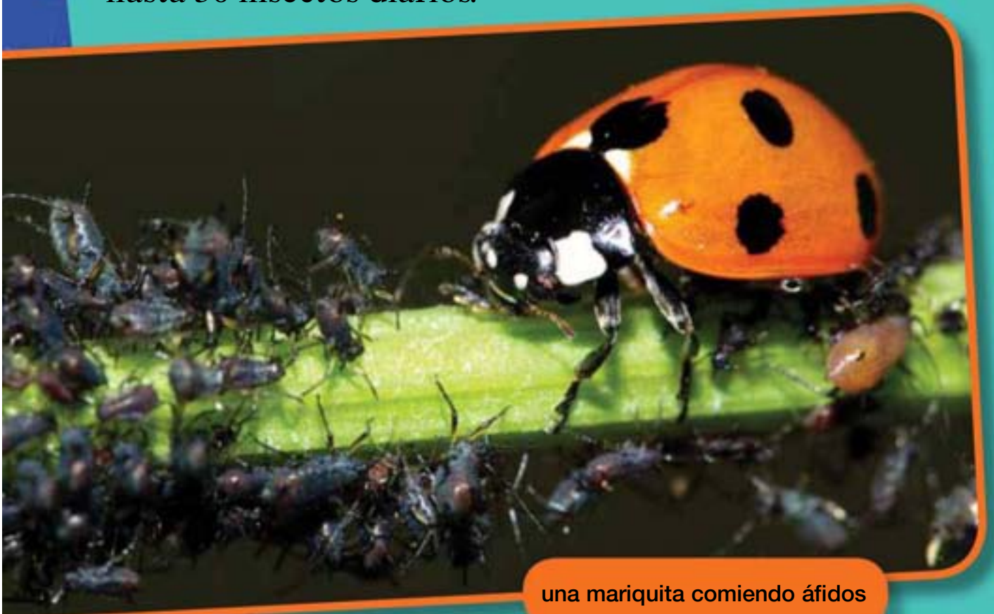
una mariquita comiendo áfidos

Hay invertebrados en el aire, bajo el agua y en la tierra. Algunos son carnívoros y comen otros animales. Las mariquitas, por ejemplo, pueden comer hasta 50 insectos diarios.