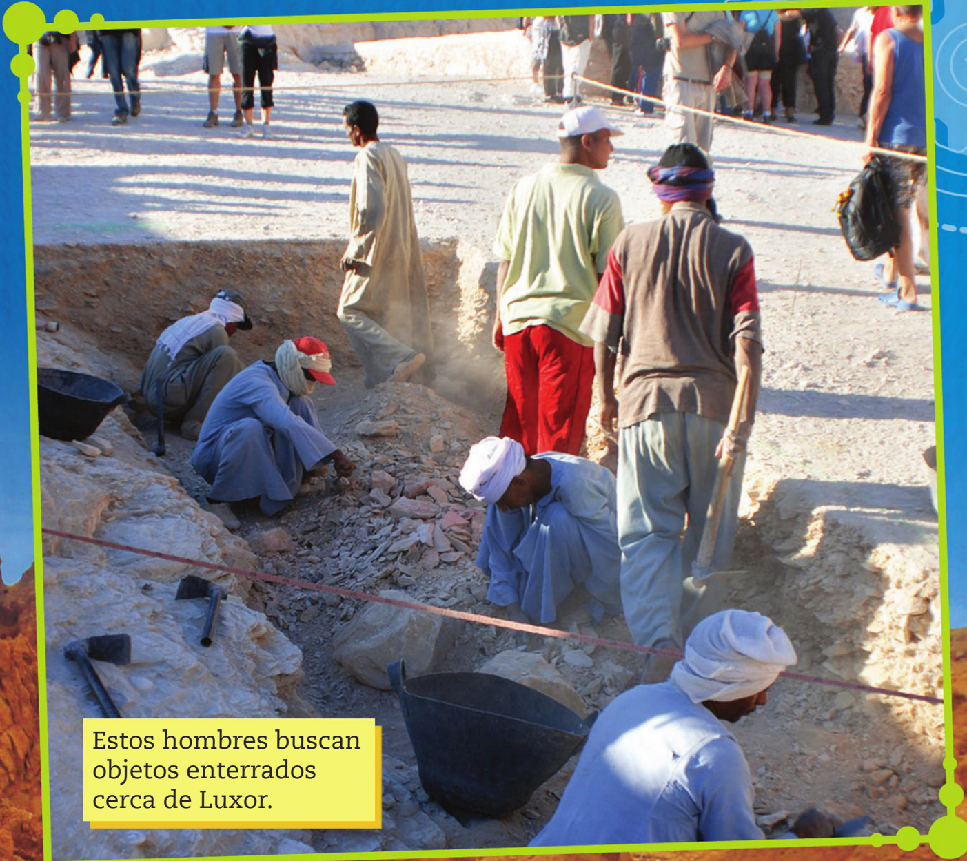
Estos hombres buscan objetos enterrados cerca de Luxor.