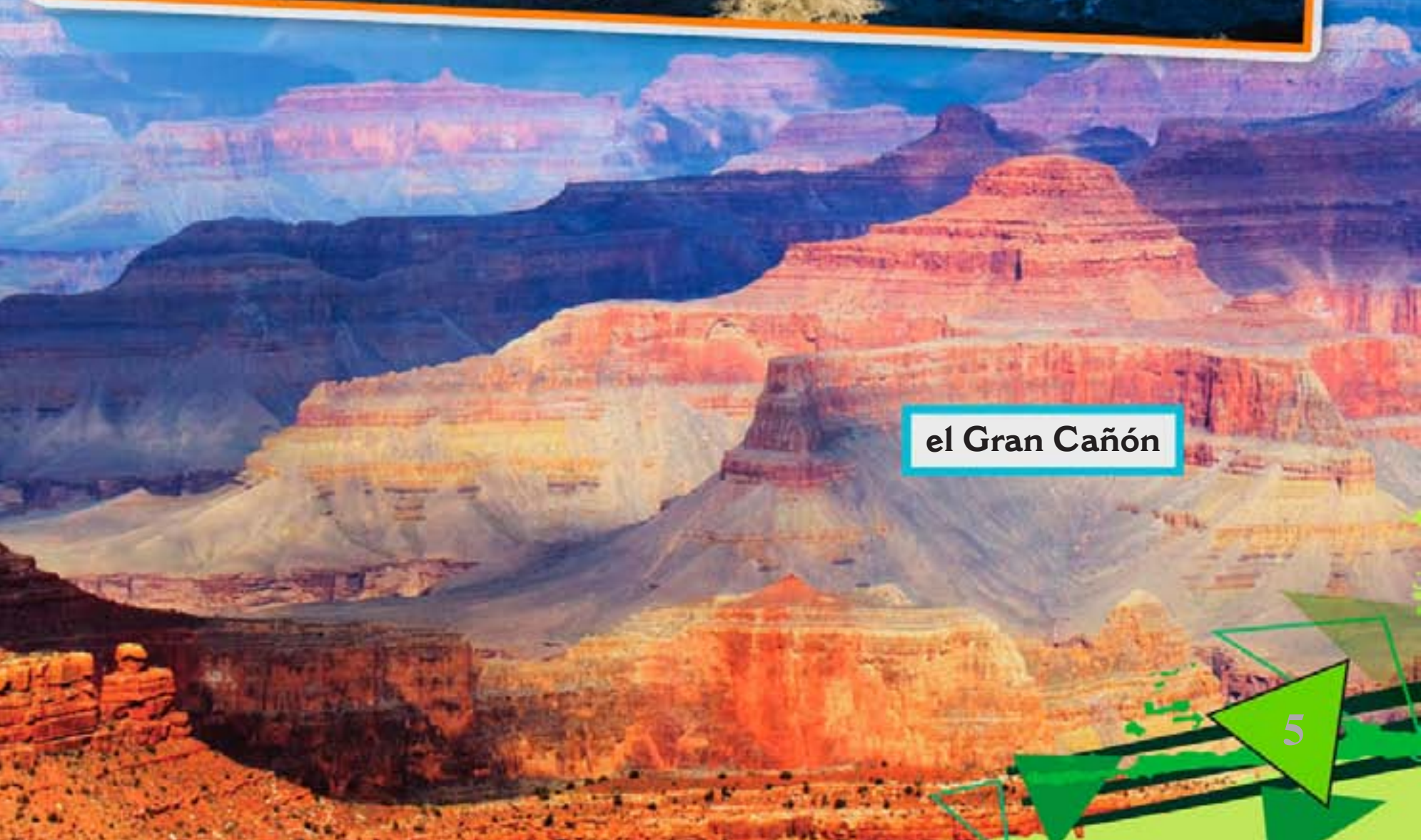
el Gran Cañón