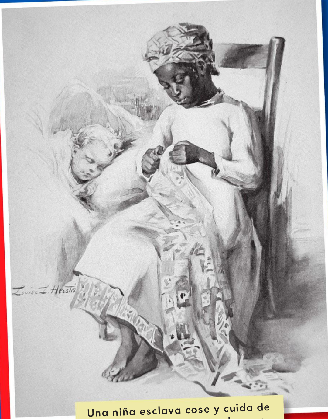
Una niña esclava cose y cuida de un bebé anglosajón que duerme.